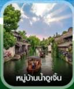
หมู่บ้านน้ำอูเจิน