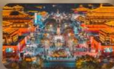
ถนนวัฒนธรรมราชวงศ์ถัง