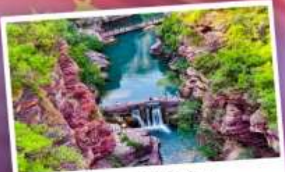
อุทยานหยูมโตซาน