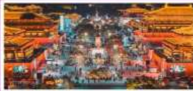
ถนนวัฒนธรรมราชวงศ์ถัง