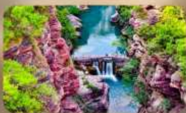
อุทยานหยุ่นโตซาน