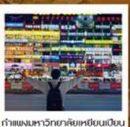
กำแพงมหาวิทยาลัยเหยียนเปียน