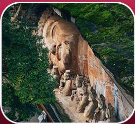
"ผาหินแกะสลักต้าจู้"