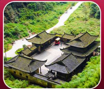
"อุทยานหลุมฟ้า"

T2G-CKG34(3U) The Best Chongqing...ฉงชิ่ง ต้าจู้ อุ่หลง เขานางฟ้า 5D 4N (3U)