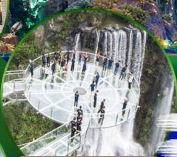
สะพานแก้วคู่หลงเซี่ยะ