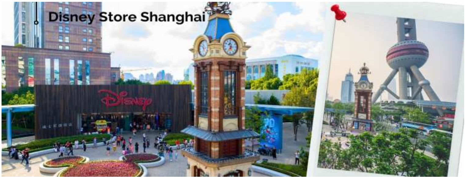
Disney Store Shanghai

นำท่านเดินทางกลับสู่มหานครเซี่ยงไฮ้ โดยใช้เวลาเดินทางประมาณ 2 ชั่วโมง จากนั้นนำท่านแวะชมความอลังการของ Disney Store Shanghai สาขาที่ใหญ่ที่สุดในโลก ให้เหล่าสาวก Disney ที่เพลิตเพลิน และเลือกซื้อสินค้าทุกคาแรกเตอร์ของ Disney จากนั้น ผ่านชมหอไข่มุก เป็นหอส่งสัญญาณวิทยุโทรทัศน์สูง 468 เมตร ลักษณะเป็นไข่มุก 11 ลูก และ เสา 3 เสา ด้านบนเป็นรูปไข่มุก 3 เม็ด 3 ขนาดเรียงกันในแนวตั้ง เมื่อชมวิว ถ่ายรูปกันจนหน้าใจแล้ว