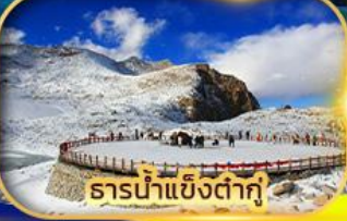
ธารน้ำแข็งต่ากู่