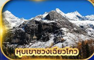
หุบเขาขวงเฉียวโกว