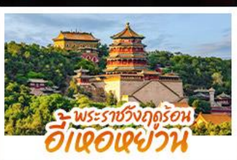
พระราชวังฤดูร้อน อี่เซวเซววัน