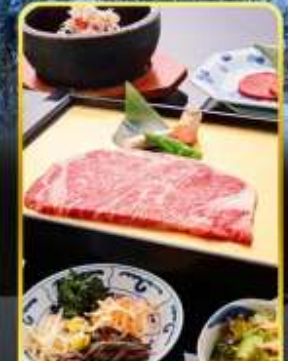
บิซึย่าง ROKKASEN

ออนเซ็น 3 คั้น มน.กระเป๋า 1 ใบ 23 กก 9Days 6Night