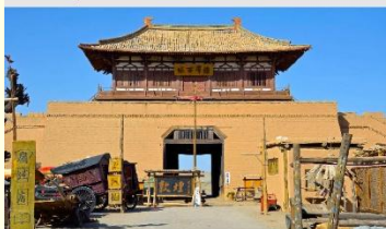
เมืองโบราณตุนหวง