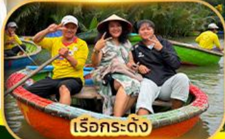
เรือกระดิ่ง